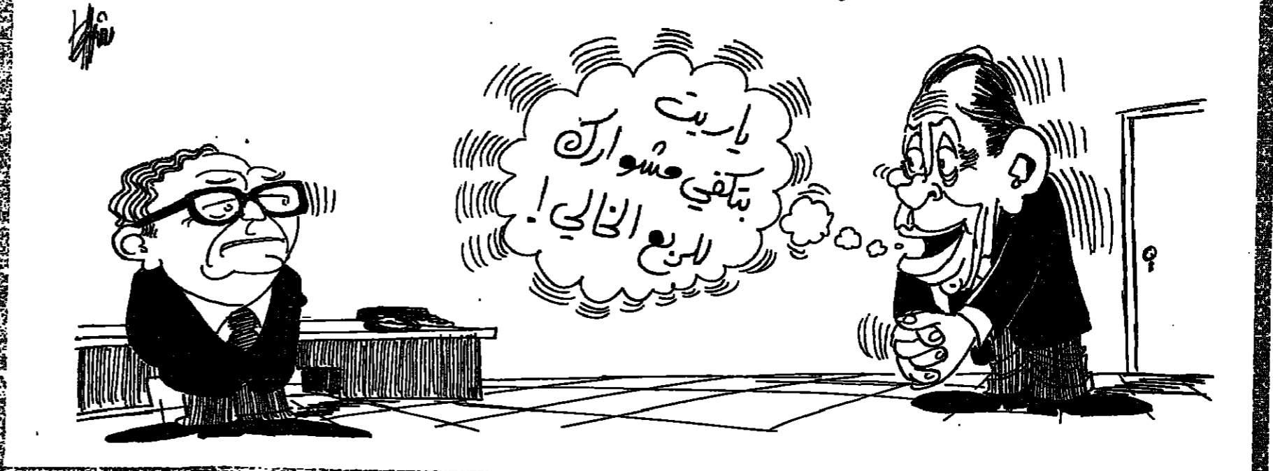
يسافر رشيد الصلح في اواخر هذا الاسبوع الى السعودية